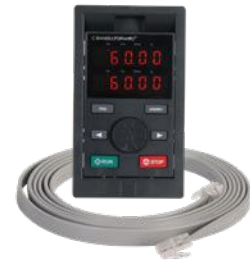
Display externo, base para el montaje y cable de conexión de 2 m