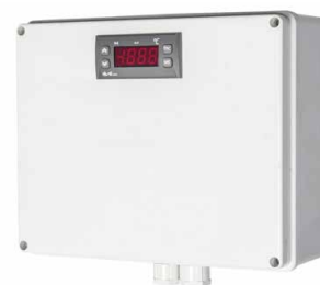
Receptor del sensor PT100